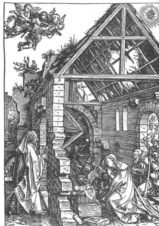
»Die Anbetung der Hirten«