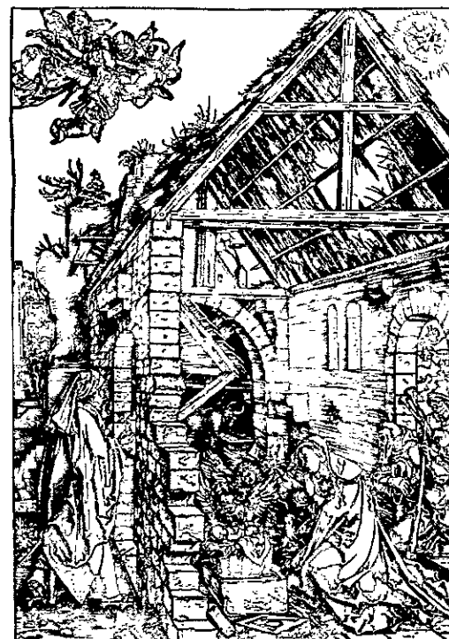
»Die Anbetung der Hirten« Ein Holzschnitt von Albrecht Dürer

„Lasset uns nun gehen gen Bethlehem und die Geschichte sehen, die da geschehen ist (Lk. 1,15)