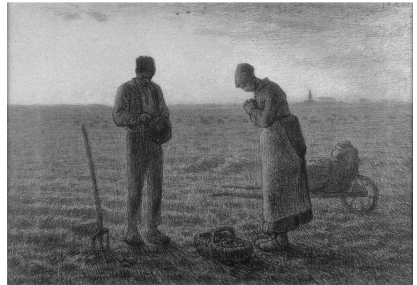
L'Angélus ein Ölgemälde von Jean-François Millet