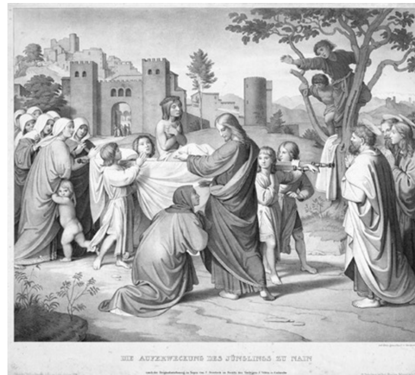
Die Auferweckung des Jünglings zu Nain Lithographie von Hermann Kauffmann „Gott hat sein Volk besucht!“ (Lk. 7,16)