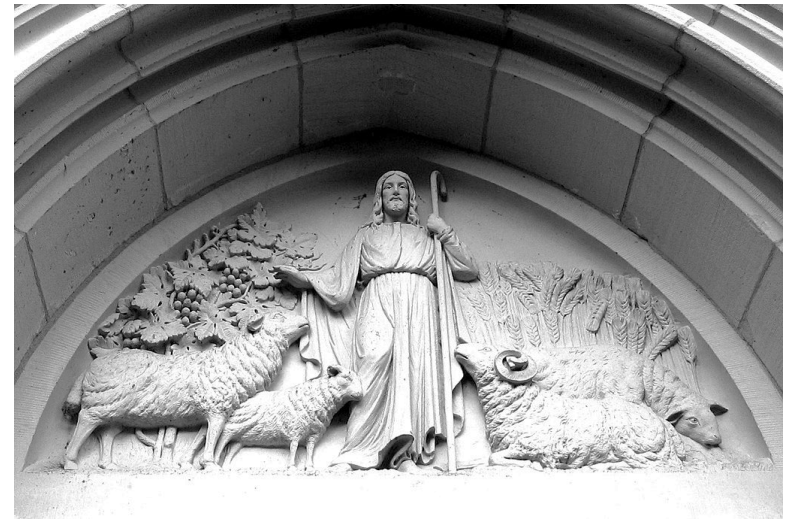
Das Tympanum der Friedenskirche – Hanau-Kesselstadt

„Ich bin der gute Hirte und kenne die Meinen und die Meinen kennen mich.“ (Joh. 10,14)