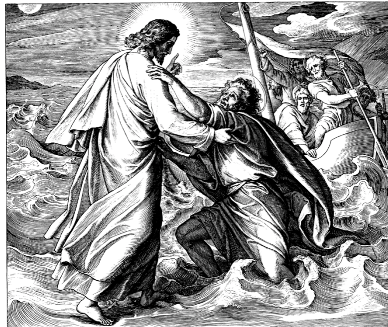
Matthäus 14, 22–33

» Jesus hält den sinkenden Petrus über dem Meer« von Julius Schnorr von Carolsfeld, um 1800