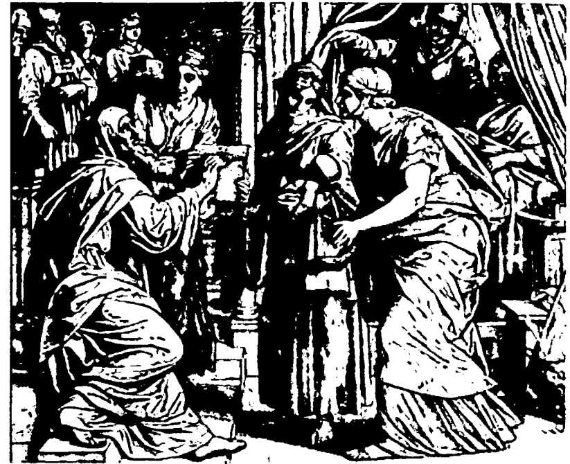
»Die Benennung des Johannes«

Ein Holzschnitt von Julius Schnorr Carolsfeld