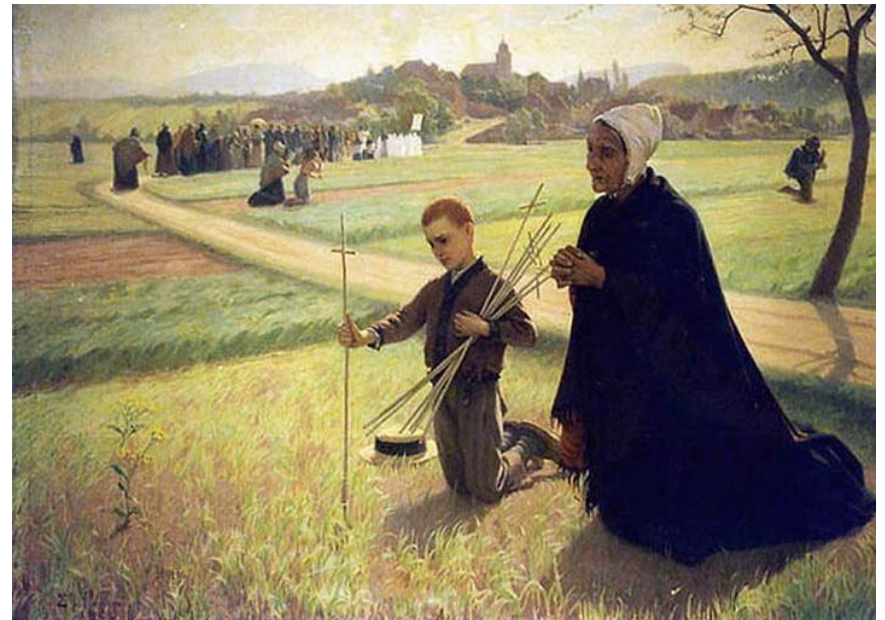
(»Les Rogations« Öl auf Leinwand von Edouard Jérôme Paupion )

„Und ich sage euch auch: Bittet, so wird euch gegeben“ (Lk. 11,9)