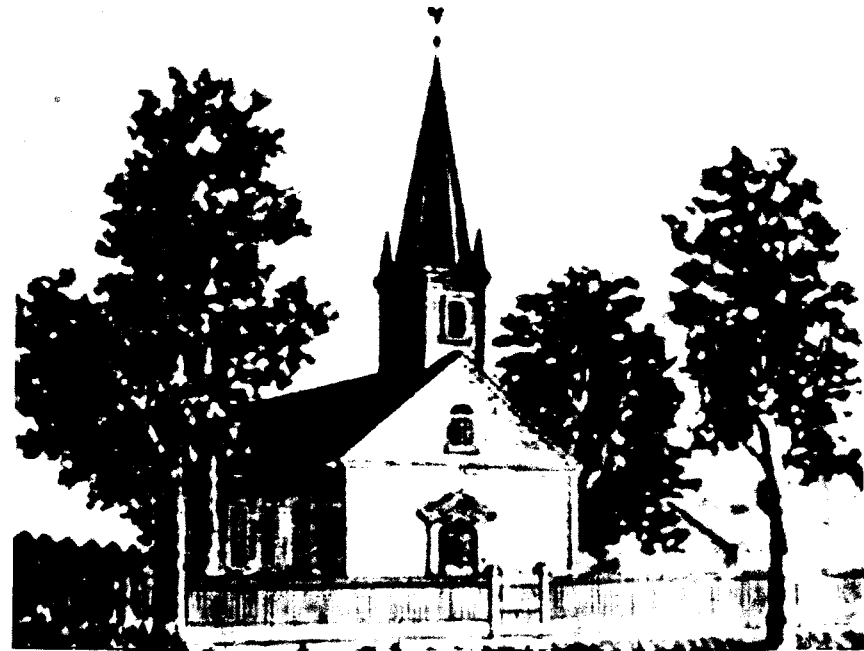
Deutsche Evangelische Gemeinde von Carrollton, 1849 (auch „The Rooster Church“ genannt)

Evangelische-Uniterte St. Matthäus-Kirche Central St. Matthew Church of Christ