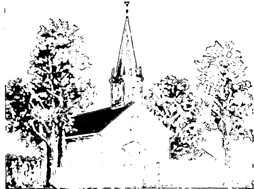
Deutsche Evangelische Gemeinde von Carrollton, 1849 (auch „The Rooster Church“ genannt)

Evangelische-Unionierte St. Matthus-Kirche