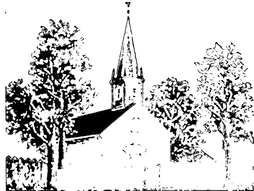
Deutsche Evangelische Gemeinde von Carrollton, 1849 (auch „The Rooster Church“ genannt)

Evangelische-Unionierte St. Matthäus-Kirche Central St. Matthew Church of Christ