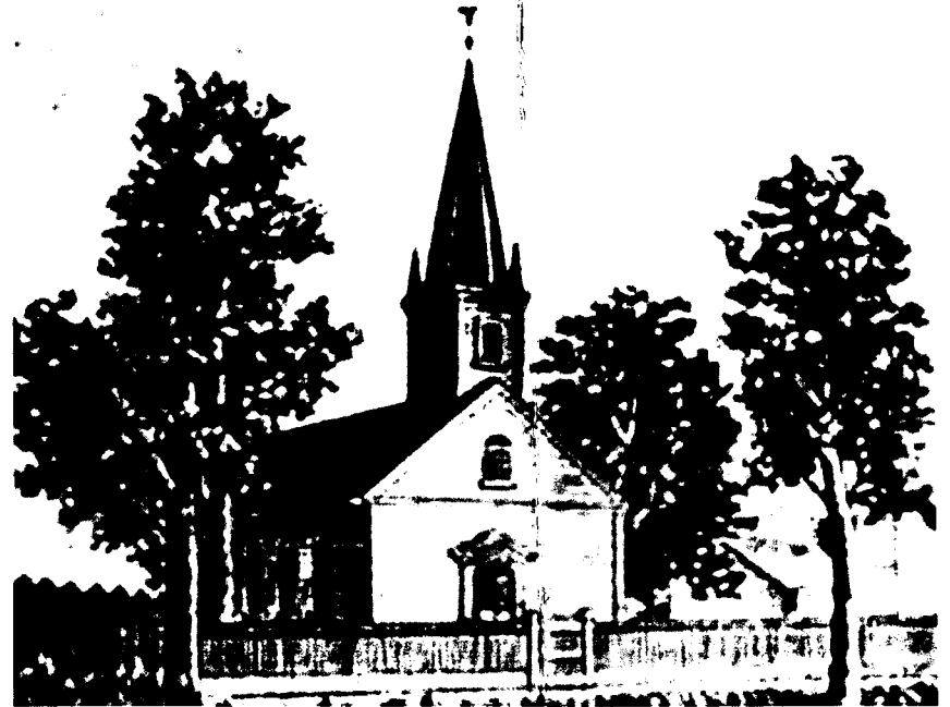
Deutsche Evangelische Gemeinde von Carrollton, 1849 (auch „The Rooster Church“ genannt)

Evangelische-Union St. Matthäus-Kirche Central St. Matthew Church of Christ