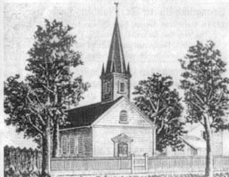
Deutsche Evangelische Gemeinde von Carrollton, 1849 (auch „The Rooster Church“ genannt)