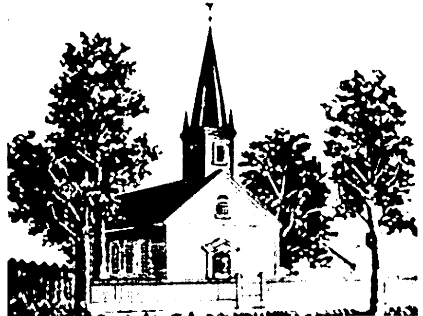
Deutsche Evangelische Gemeinde von Carrollton, 1849