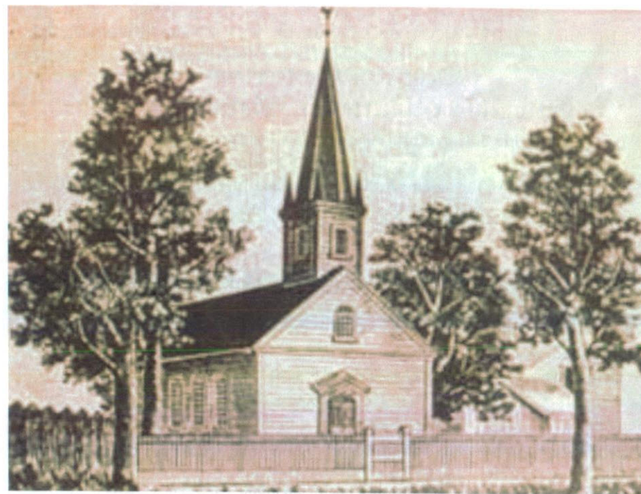
Deutsche Evangelische Gemeinde von Carrollton, 1849 (auch „The Rooster Church“ genannt)