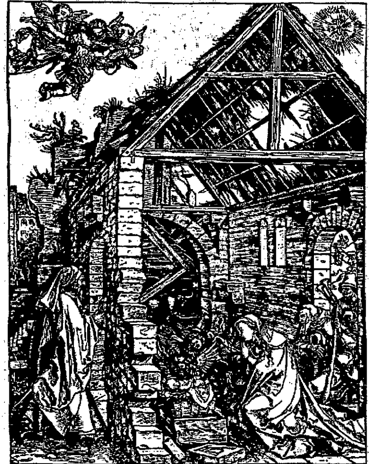
Albrecht Dürer, Die Anbetung der Hirten , 1505

Evangelisch-Unierte St. Matthäus-Kirche Central St. Matthew United Church of Christ Am HEILIGEN ABEND, dem 24. Dezember 2014, um 16.00 Uhr.