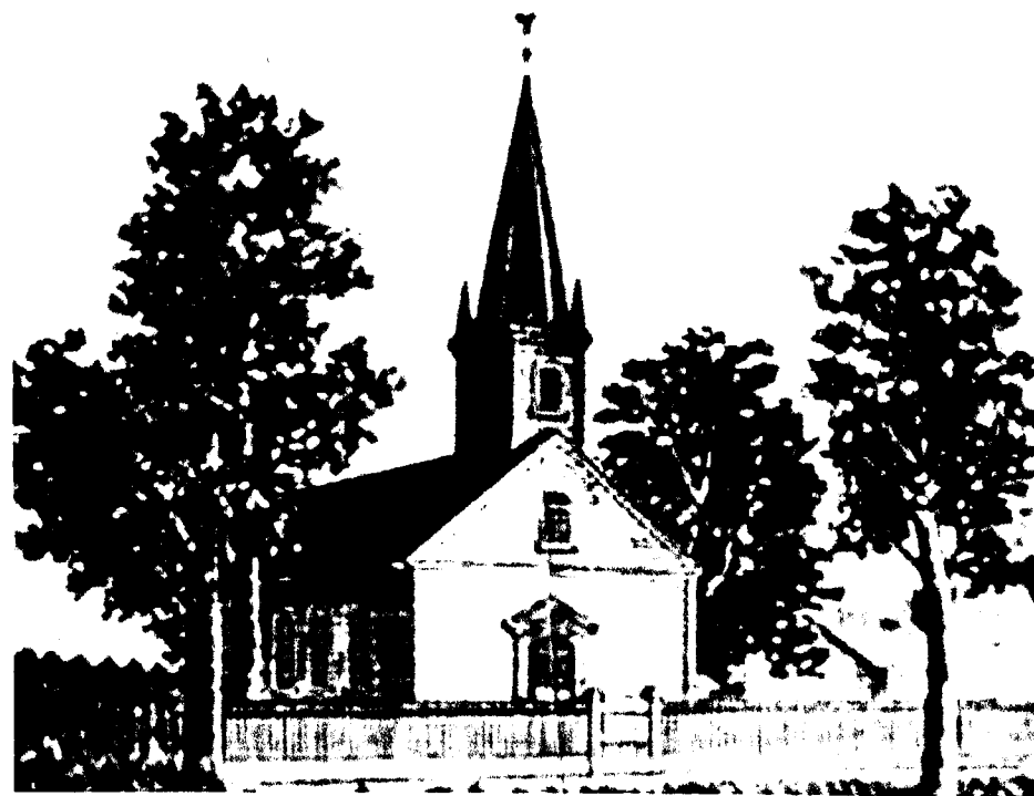
Deutsche Evangelische Gemeinde von Carrollton, 1849 (auch „The Rooster Church“ genannt)

Evangelisch-Unierte St. Matthäus-Kirche Central St. Matthew United Church Of Christ