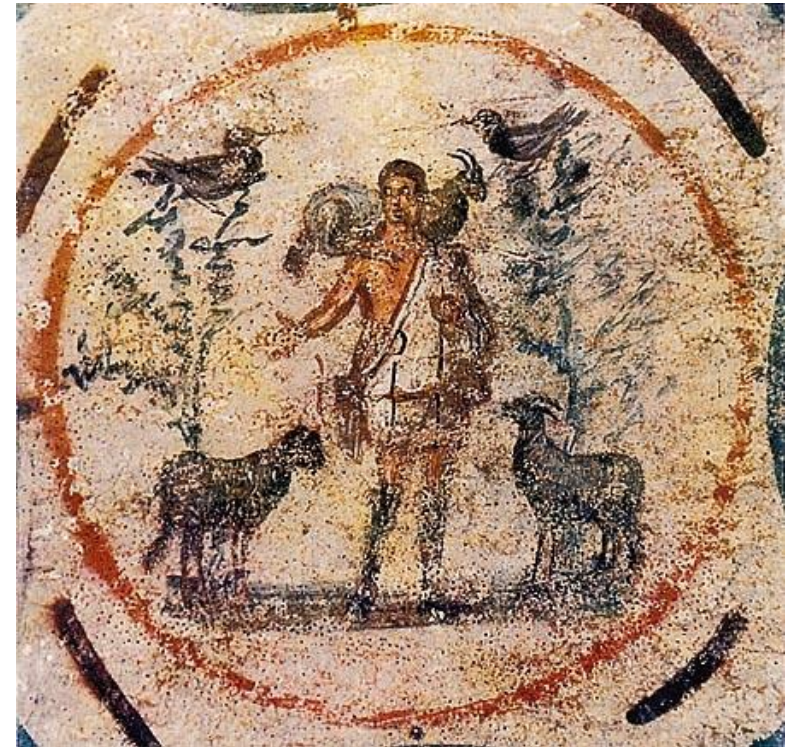
Jesus, der gute Hirte Fresko in der Calixtus-Katakombe, Rom (ca 250 n.Chr.)

Evangelisch-Unierte St. Matthäus-Kirche Central St. Matthew United Church Of Christ