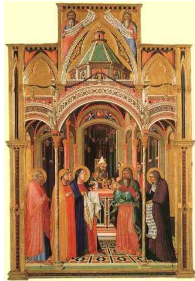
Ambrogio Lorenzetti: Altarbild, 1342, Galleria degli Uffizi in Florenz Darstellung des Herrn im Tempel

AM 4. SONNTAG NACH EPIPHANIAS, DEM 2. FEBRUAR 2014, UM 14.00 UHR, TAG DER DARSTELLUNG DES HERRN (LICHTMESS)