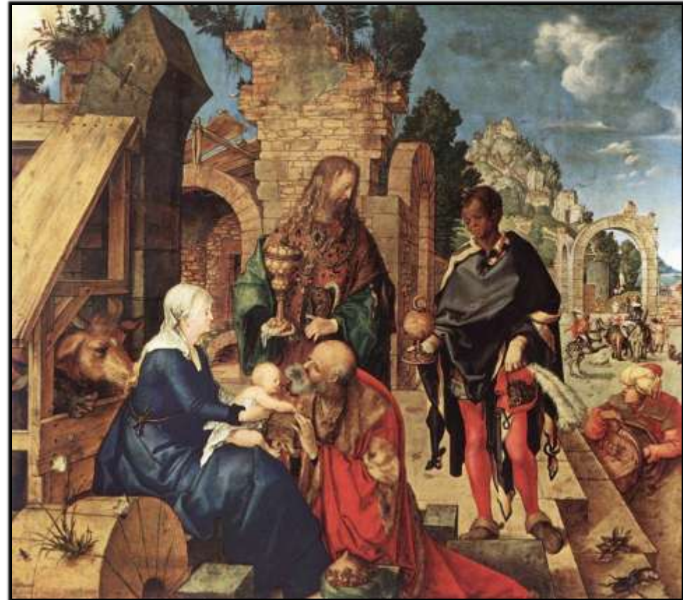
Albrecht Dürer, Die Anbetung der Weisen , 1503

Evangelisch-Unierte St. Matthäus-Kirche Central St. Matthew United Church of Christ