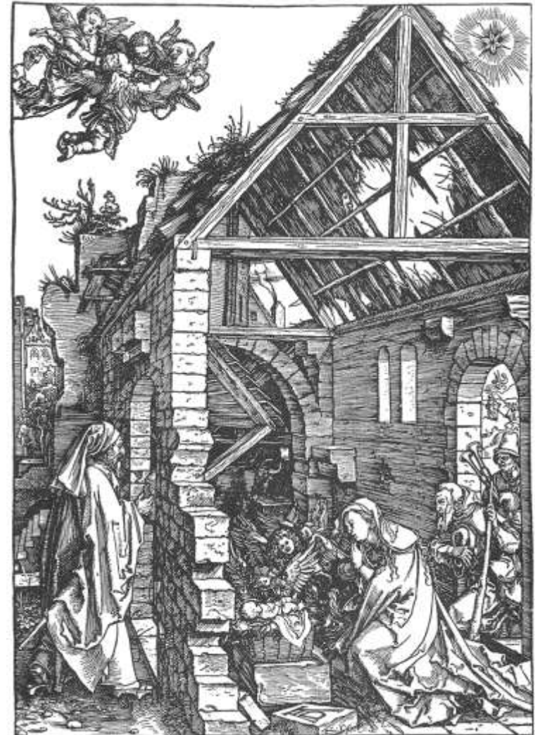
Albrecht Dürer, Die Anbetung der Hirten , 1505

NÄCHSTER GOTTESDIENST: Am 2. Sonntag nach dem Christfest, Sonntag nach Neujahr, dem 5. Januar 2014, um 14 Uhr. Anschließend im Gemeindesaal: gemütliches Beisamensein mit Kaffee und Kuchen – und Videofilmvorführung.