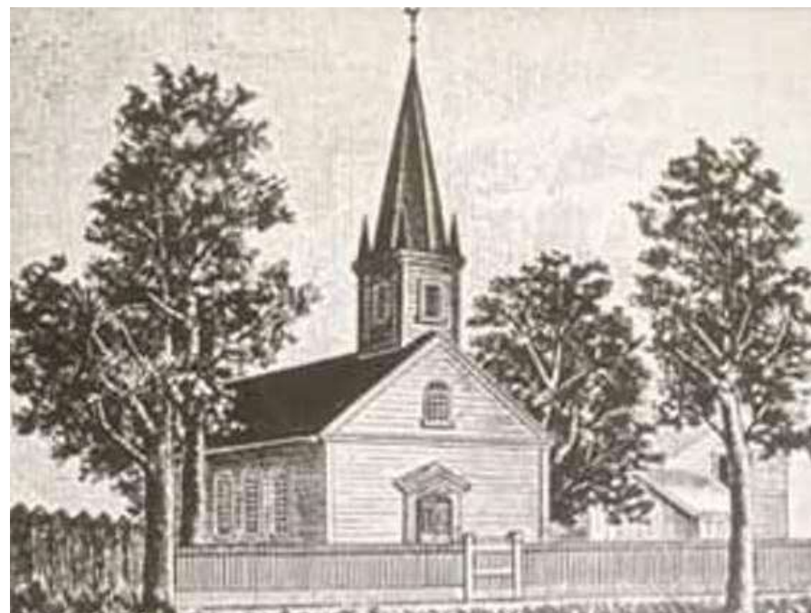
Deutsche Evangelische Gemeinde von Carrollton, 1849 (auch „The Rooster Church“ genannt)