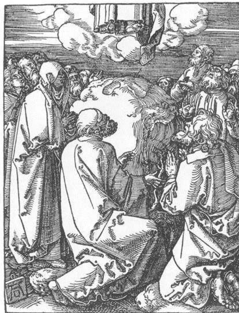
Christi Himmelfahrt, Die Kleine Passion , Albrecht Dürer, 1511

EVANGELISCH-UNIERTE ST. MATTHÄUS-KIRCHE AM SONNTAG ROGATE, DEM 5. MAI 2013, UM 14.00 UHR